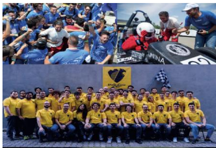
Team di UNINA corse supportato da studenti e docenti del percorso IMEA

Tali competenze sono fortemente trasversali su differenti settori applicativi dei mondi industriale, civile, dei servizi e della consulenza e potranno essere conseguite scegliendo uno dei tre percorsi formativi proposti ( Sistemi Energetici Innovativi , Gestione Avanzata dell'Energia , Sistemi Propulsivi ) ovvero attraverso percorsi individuali disegnati dallo studente in stretta cooperazione con i docenti del Corso di Studio.